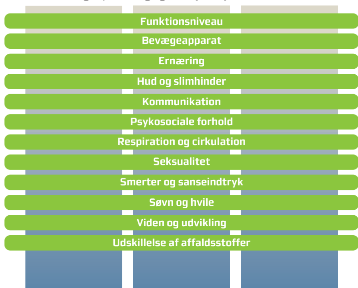
Fig. 1: Sygeplejens breddefaglighed udgøres af de 12 selvstændige områder, markeret med de horisontale bjælker. De lodrette bjælker illustrerer sygeplejens dybdefaglighed (5)

Der er behov for at nuancere og videreudvikle beskrivelsen af kompetencerne for sygeplejersken i akutafdelingen samt akutafdelingens overordnede kompetence- og funktionsområder på det sygeplejefaglige område. Dette synliggøres med udgangspunkt i "Teori-T", som beskriver sygeplejerskens bredde- og dybdefaglighed (5,10)